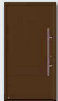
Terrabraun RAL 8028