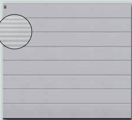
RenoMatic Micrograin für € 999,-