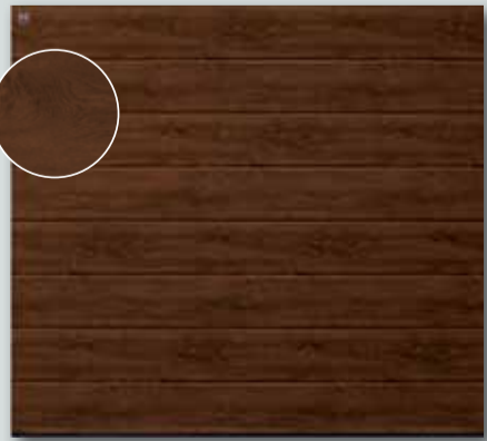
RenoMatic Decograin für € 999,-