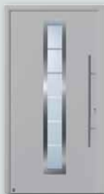
RenoDoor Color für € 1.349,-