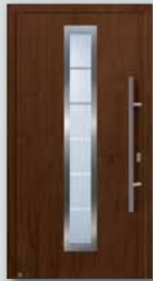
RenoDoor Decograin für € 1.349,-