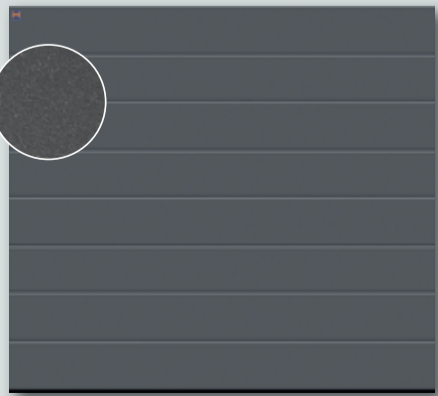
RenoMatic Decograin für € 999,-