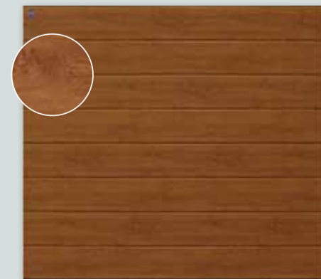
RenoMatic Decograin für € 999,-