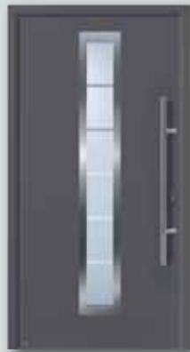
RenoDoor Decograin für € 1.349,-