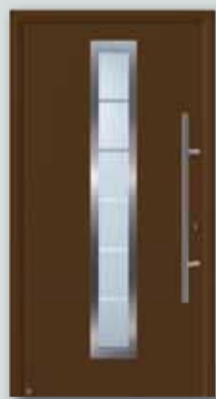
RenoDoor Color für € 1.349,-