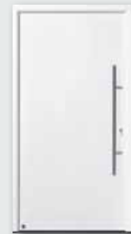
Verkehrsweiß RAL 9016

Baugleich zu Hörmann ThermoPro Eingangstüren mit Aluminium-Zarge in 3 preisgleichen Farben und in der Aktionsgröße 1100 x 2100 mm , Bautiefe 46 mm. Andere Türgrößen auf Anfrage lieferbar.