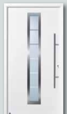
RenoDoor für € 1.249,-