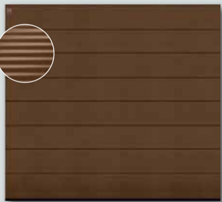
RenoMatic Micrograin für € 999,-