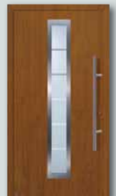
RenoDoor Decograin für € 1.349,-